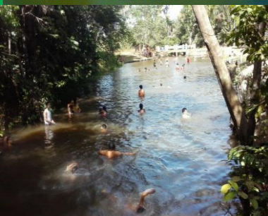
Vila de Patauí