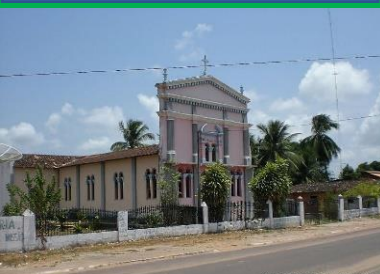
Igreja de São Pedro